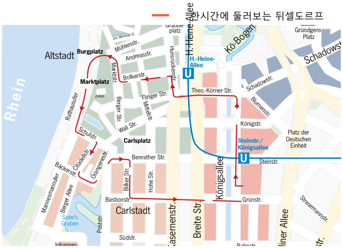
한시간에 둘러보는 뒤셀도르프